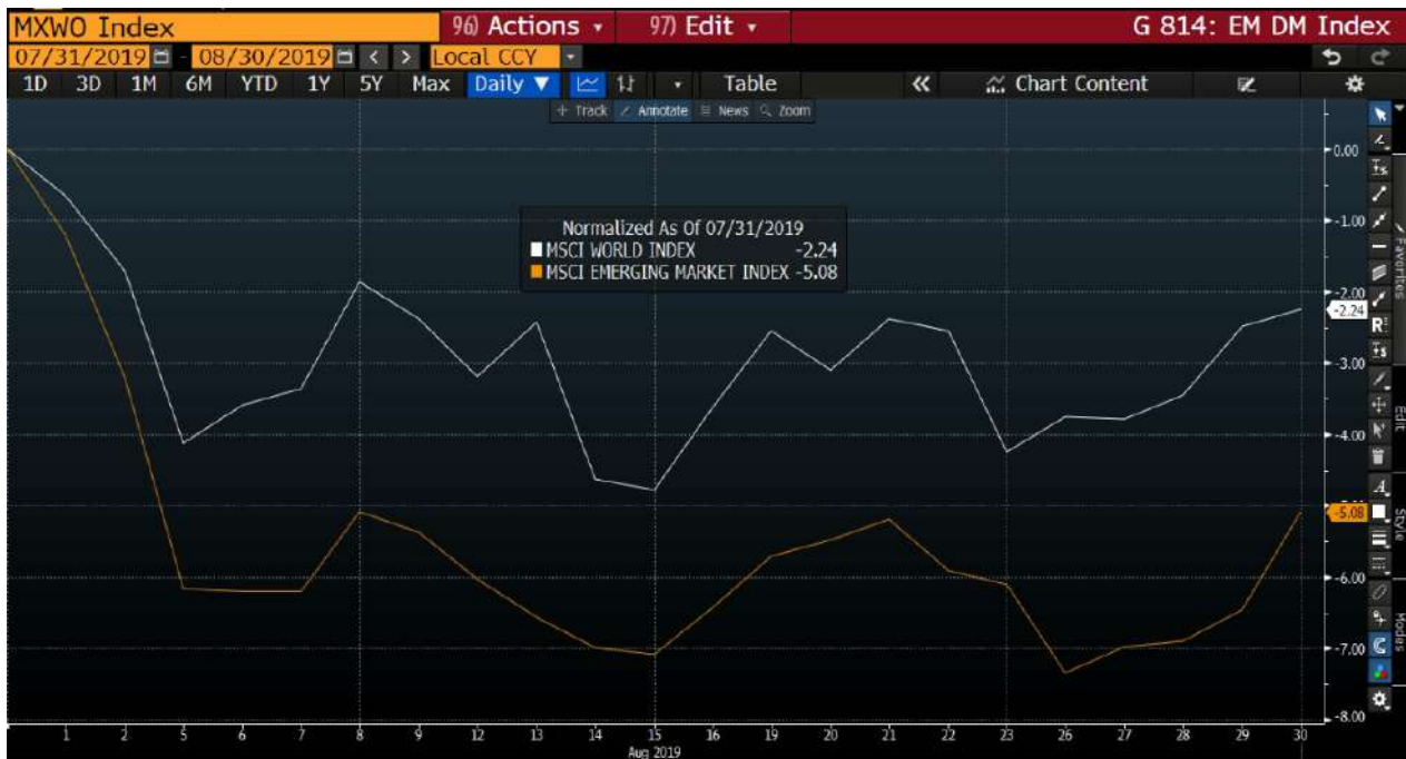
圖表 1. 2019 年 MSCI 新興市場和 MSCI 世界指數回歸回報