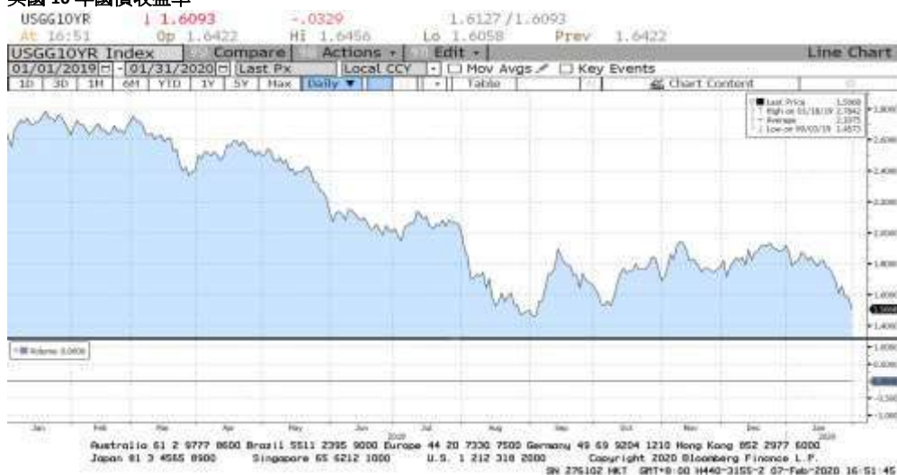
FIGURE 1 美國 10 年期國債收益率