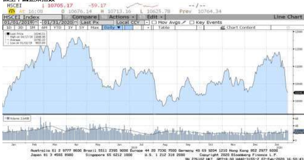
FIGURE 2 恆生中國企業指數