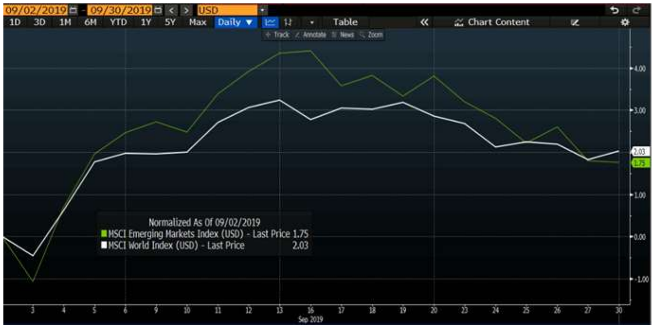
图表 1. 2019年9月份 MSCI 新兴市场 and MSCI 世界指数回报