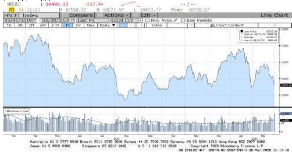
FIGURE 2 恒生中国企业指数