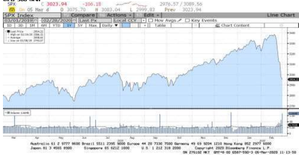
FIGURE 3 标普 500 指数