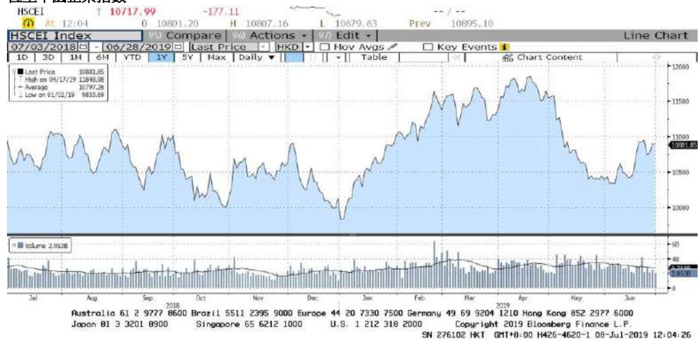
FIGURE 2 恆生中國企業指數