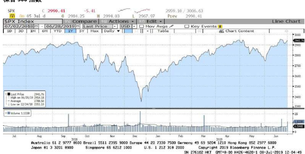
FIGURE 3 標普 500 指數