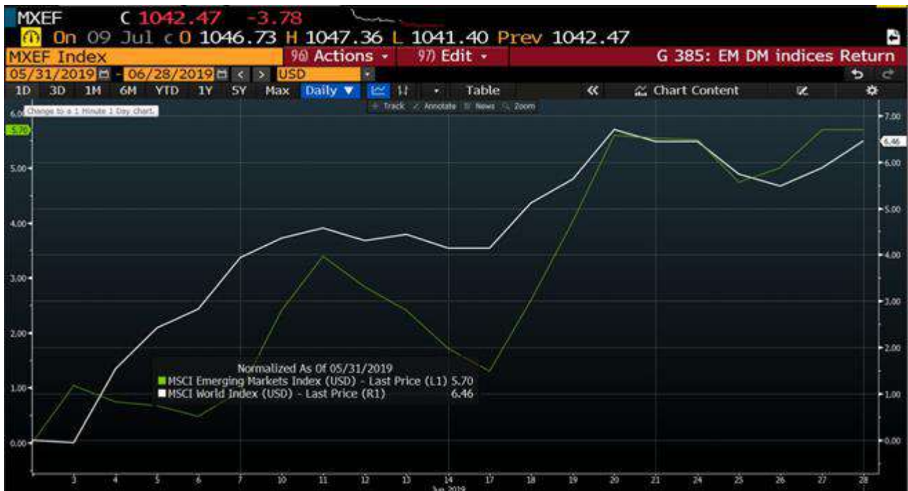
圖表 1. 2019 年 MSCI 新興市場和 MSCI 世界指數回歸回報