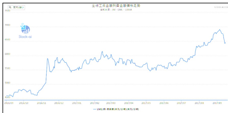
圖表 2: 最新一年銅的走勢圖